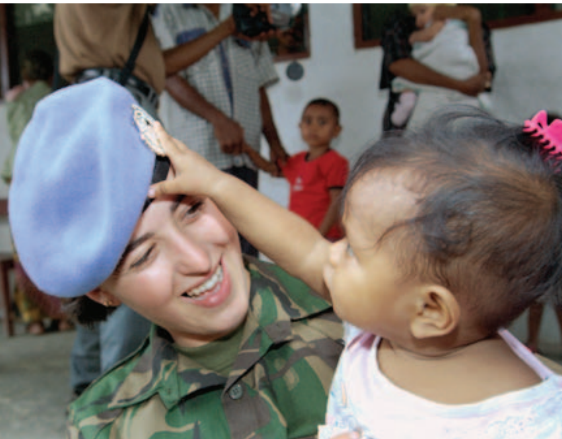
Batallón de Infantería de las Naciones Unidas: Protección, paz y prosperidad